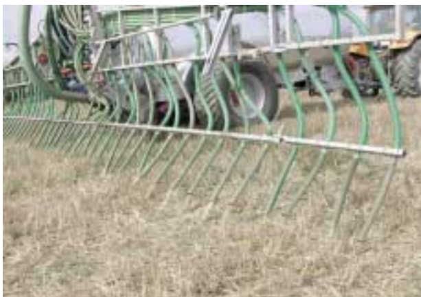
Figura 3. Aplicación de purín mediante el método de rampa con tubos colgantes

El sistema de tubos colgantes ( Figura 3 ) está constituido por una tubería general que sale de la cuba, conectada a un triturador-distribuidor que abastece a distintas mangueras que cuelgan sobre un soporte de acero (plegable para el transporte) y distan entre sí alrededor de 20-30 cm. Estas mangueras tienen un diámetro de 4-6 cm, por lo que precisan del triturador-distribuidor para evitar obturaciones, y depositan el purín directamente sobre el suelo.