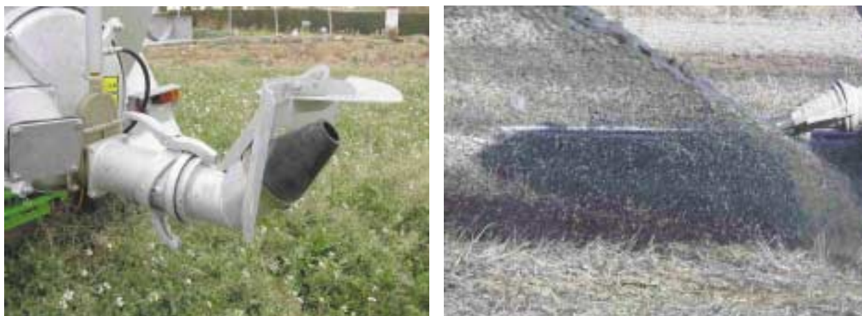
Figura 1. Aplicación de purín mediante el método tradicional de aspersión en abanico (dcha) y abanico invertido (izda)

El sistema tradicional se basa en una boquilla de gran diámetro que proyecta el purín sobre una chapa denominada plato (de forma plana ó cóncava) de tal manera que es proyectado hasta una altura de entre 2 y 3 m formando un abanico ( Figura 1 ) con una anchura de aplicación de entre 7-12 m. También existe una variante de este método en el que el plato se encuentra en posición invertida, en este caso el abanico formado se eleva menos y se atenúan las emisiones.