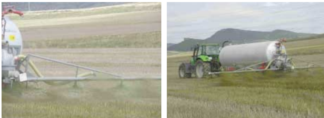
Figura 2. Aplicación de purín mediante la rampa multiboquilla

El método de rampa multiboquilla ( Figura 2 ) consiste en tubería (plegable para el transporte) de un diámetro de 15-20 cm alimentada por mangueras centrales que salen de la cuba. De la tubería pueden salir desde 2 a 14 boquillas que distan del suelo entre 30 y 50 cm.